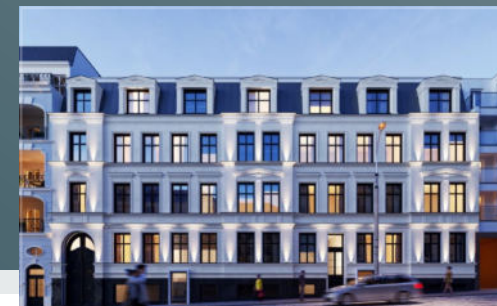
Widok na budynek od frontu

Odnowione zostały nie tylko wnętrza i elewacja, ale także dziedziniec.