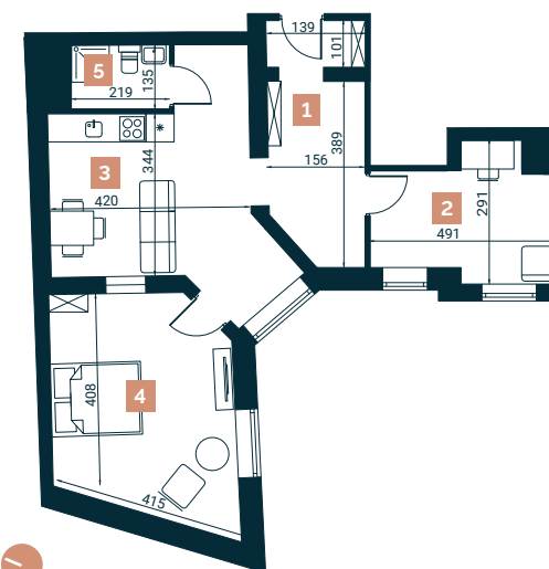
Rzut lokalu nr 26+27