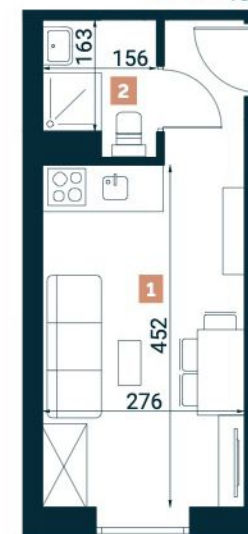
Rzut lokalu nr 13