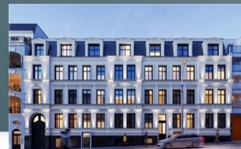
Widok na budynek od frontu

Odnowione zostały nie tylko wnętrze i elewacja, ale także dziedziniec.