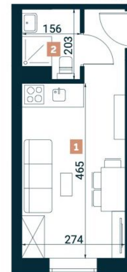
Rzut lokalu nr 18