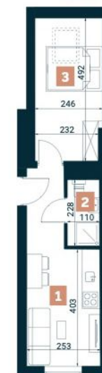
Rzut lokalu nr 20