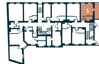
Rzut kondygnacji – Parter