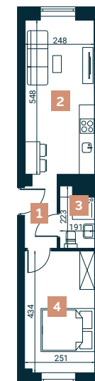
Rzut lokalu nr 10