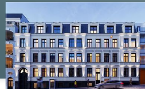
Widok na budynek od frontu

Odnowione zostały nie tylko wnętrze i elewacja, ale także dziedziniec.