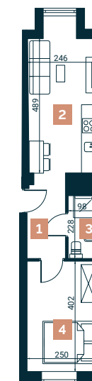
Rzut lokalu nr 15