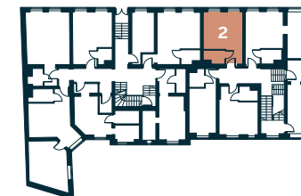
Rzut kondygnacji – Parter