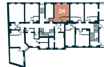
Rzut kondygnacji – Parter