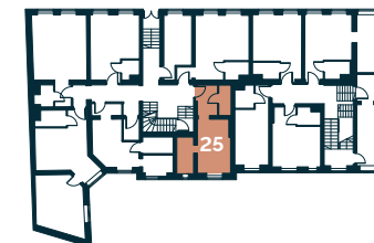
Rzut kondygnacji – Parter