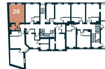
Rzut kondygnacji – Parter