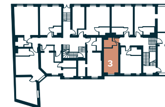
Rzut kondygnacji – Parter