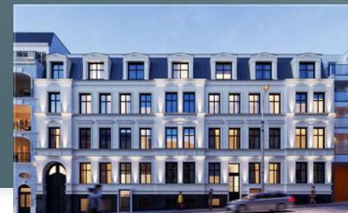
Widok na budynek od frontu

Odnowione zostały nie tylko wnętrza i elewacja, ale także dziedziniec.