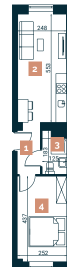
Rzut lokalu nr 5