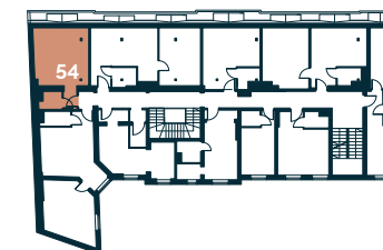
Rzut kondygnacji – Piętro IV